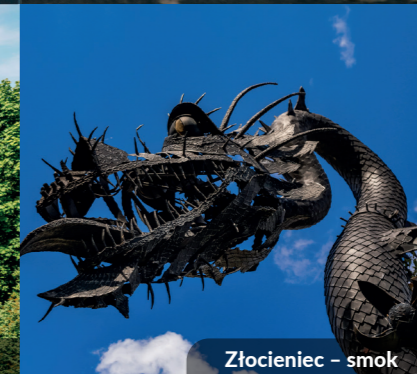
Złocieniec - smok

Pobierz aplikację "Pomorze Zachodnie" i wsiadaj na rower!