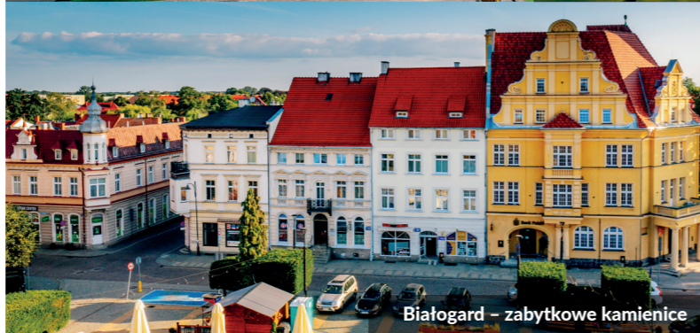
Białogard - zabytkowe kamienice