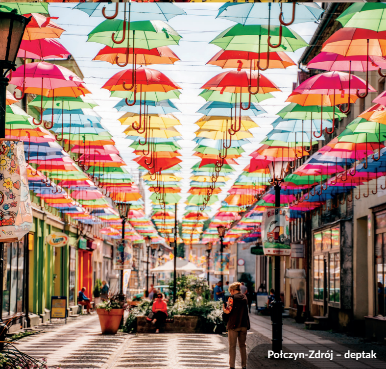
Połczyn-Zdrój - deptak