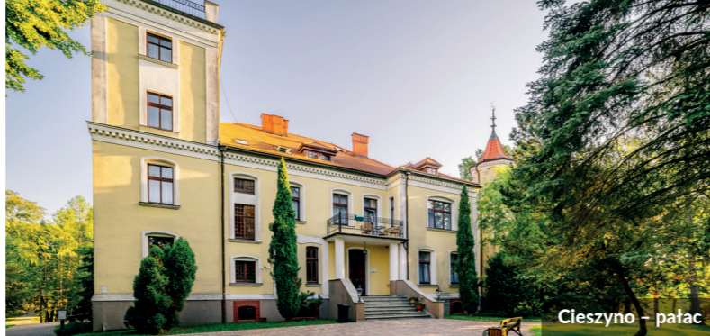
Cieszyń - pałac

Projekt dofinansowany przez Unię Europejską ze środków Europejskiego Funduszu Społecznego w ramach Regionalnego Programu Operacyjnego Województwa Zachodniopomorskiego 2014-2020.