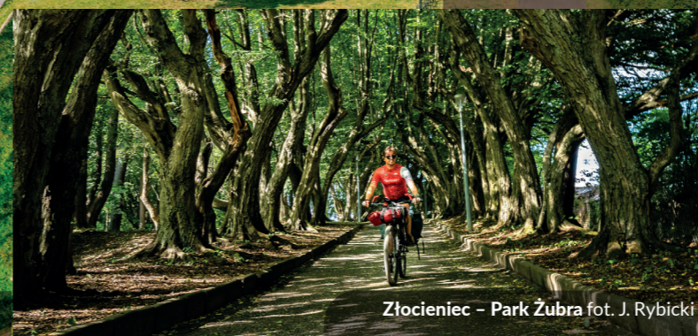
Złocieniec - Park Żubra