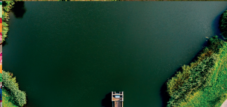
Połczyn-Zdrój - zapora na Wogrze