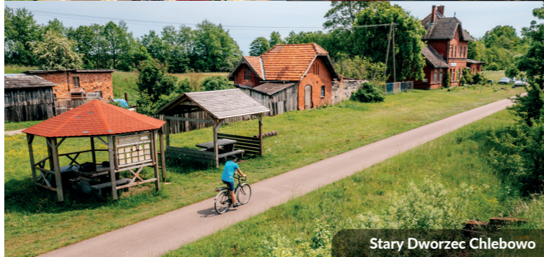
Stary Dworzec Chlebowo