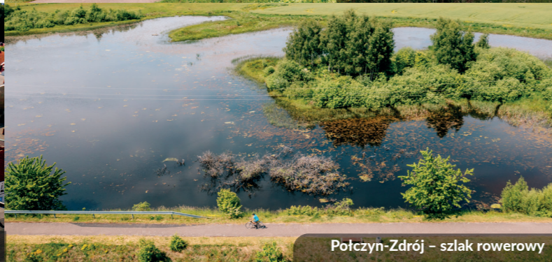
Połczyn-Zdrój - szlak rowerowy