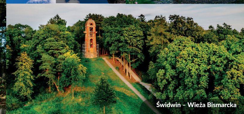
Świdwin - Wieża Bismarcka