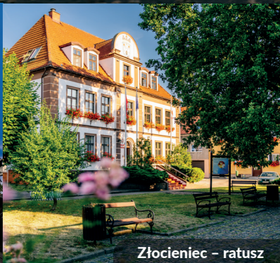
Złocieniec - ratusz