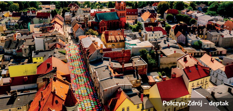
Połczyn-Zdrój - deptak