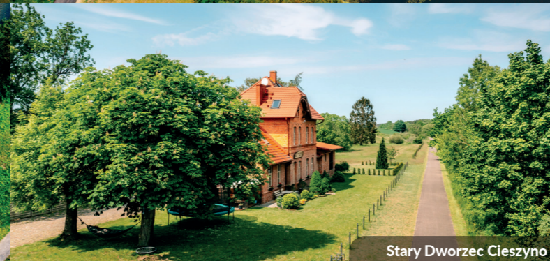
Stary Dworzec Cieszyń