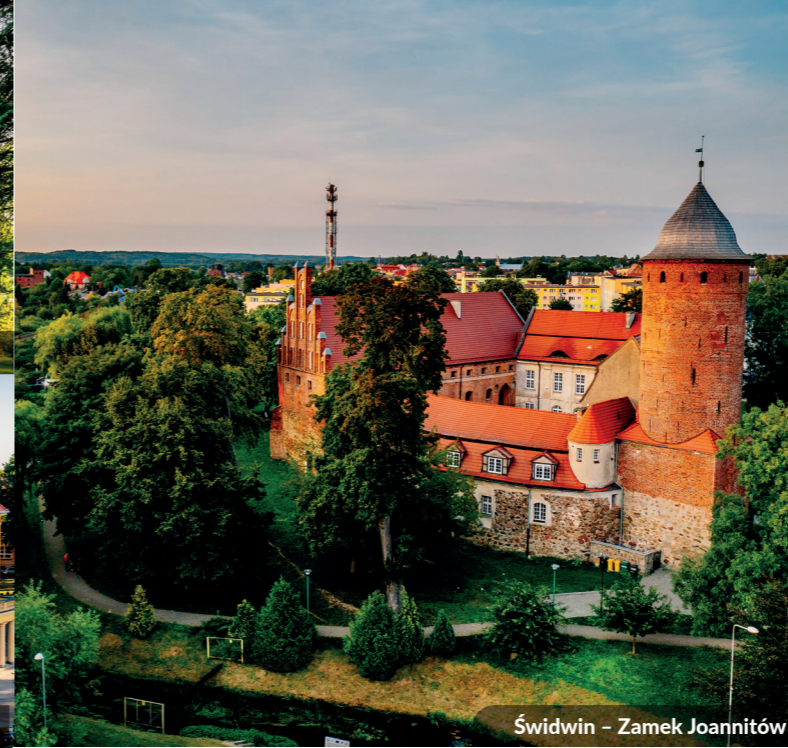
Świdwin - Zamek Joannitów