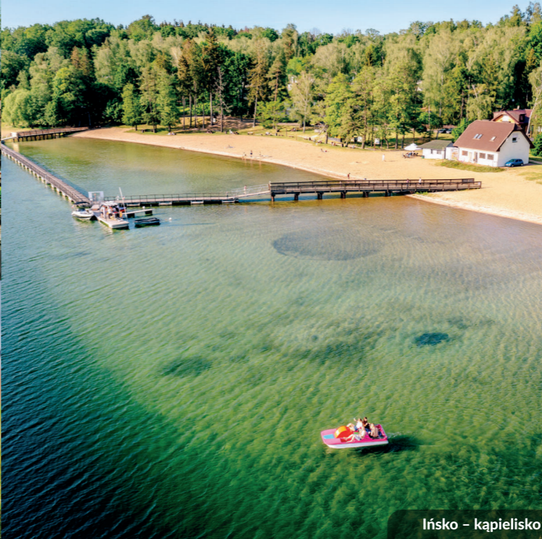
Ińsko – kąpielisko