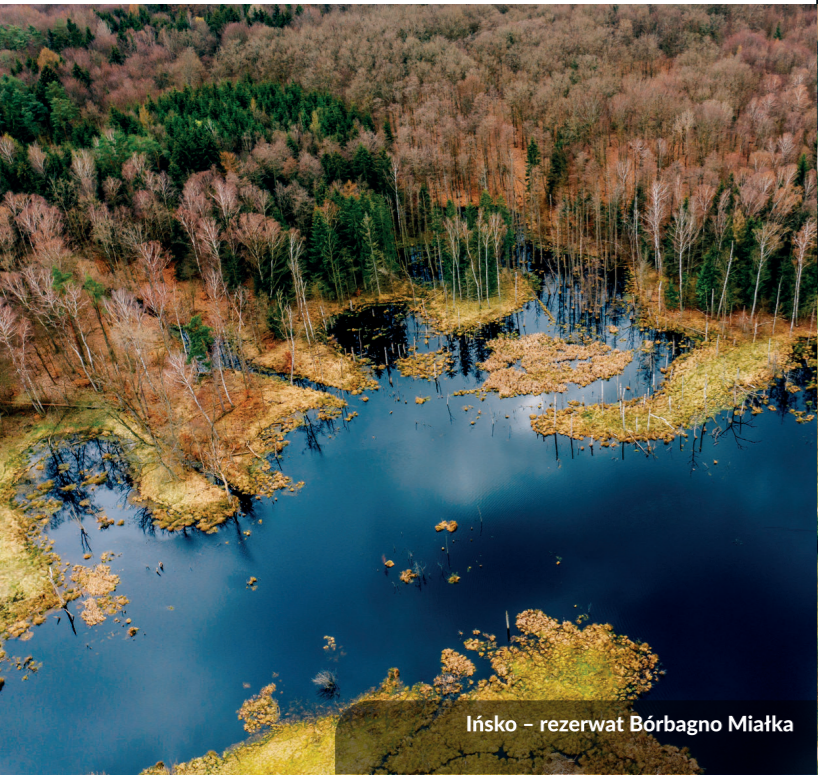
Ińsko – rezerwat Bórbagno Miałka