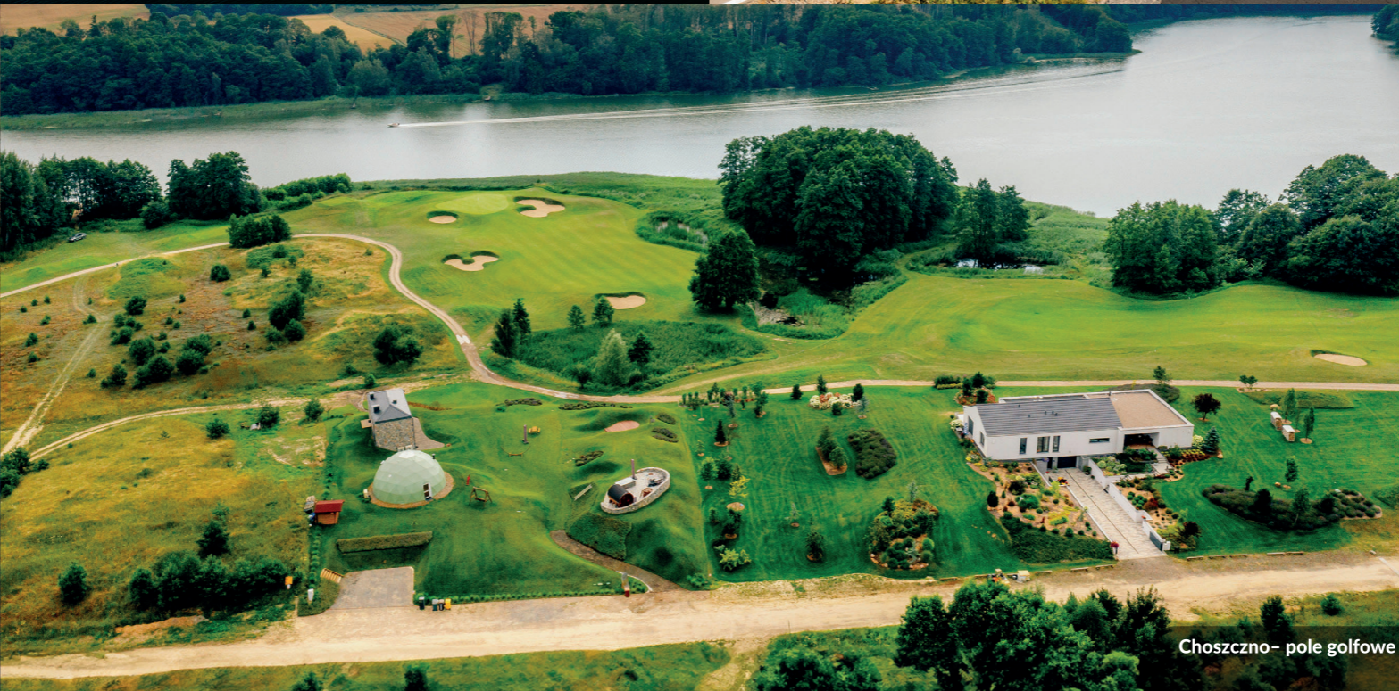
Choszczno – pole golfowe