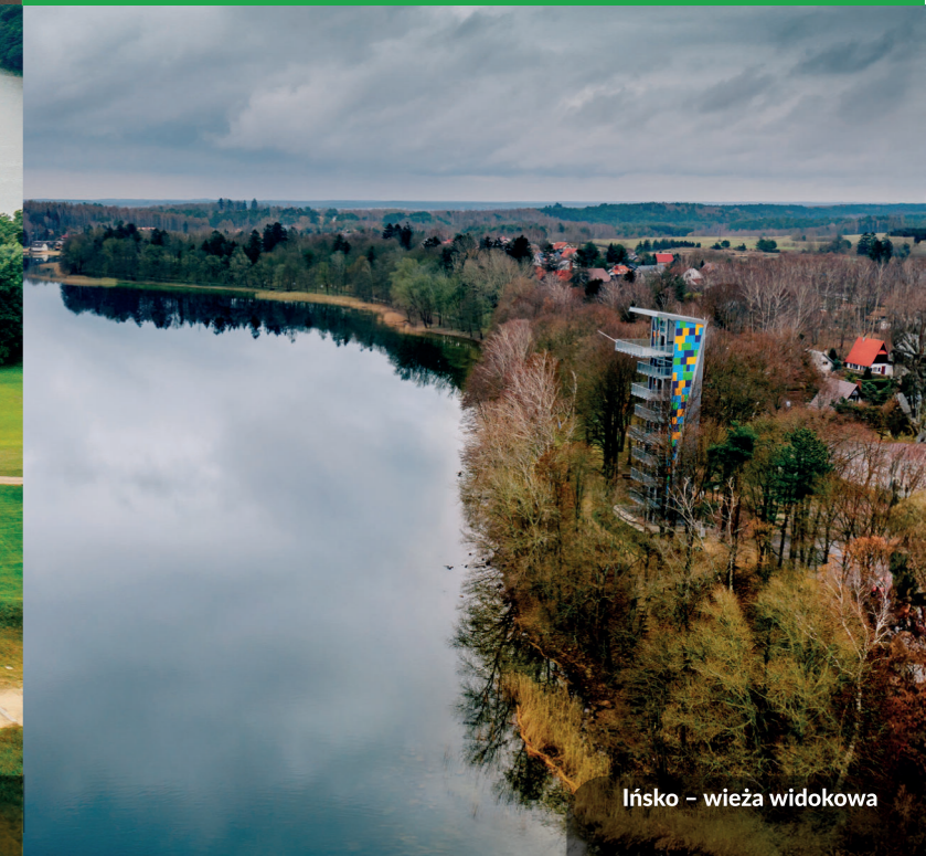
Ińsko – wieża widokowa