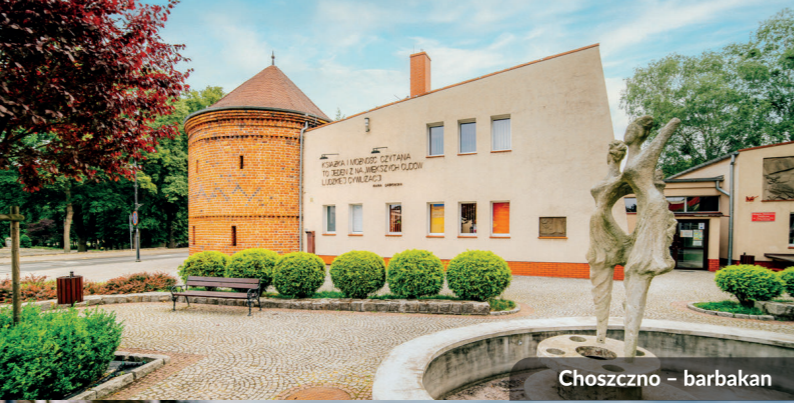
Choszczno – barbakan

Budowę tras rowerowych dofinansowano z Funduszy Europejskich