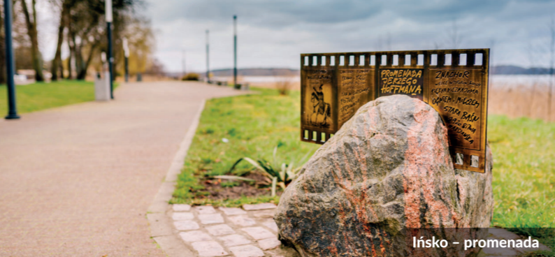
Ińsko – promenada