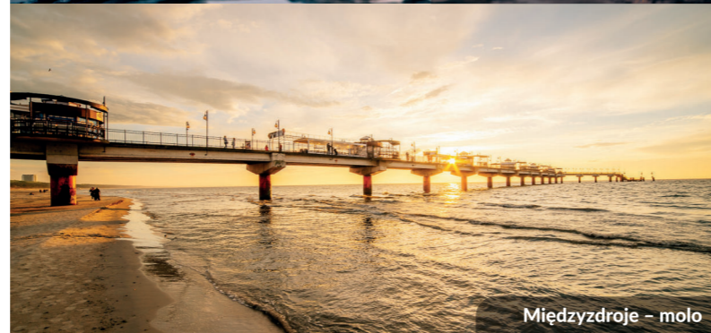
Międzyzdroje – moło