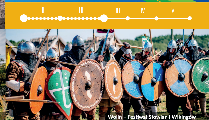
Wolin – Festiwal Słowian i Wikingów