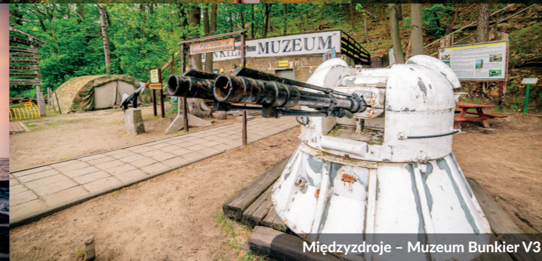
Międzyzdroje – Muzeum Bunkier V3