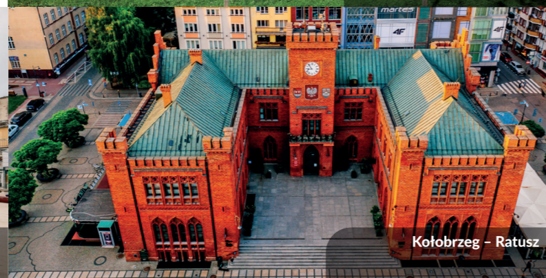
Kołobrzeg – Ratusz