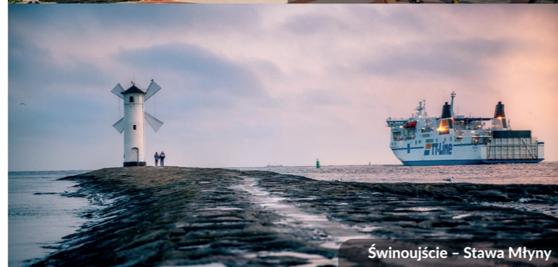
Świnoujście – Stawa Młyny