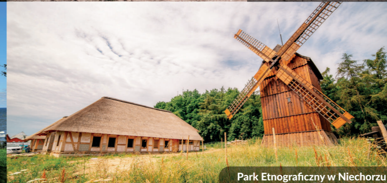
Park Etnograficzny w Niechorzu