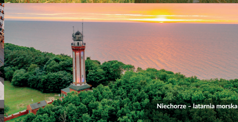
Niechorze – latarnia morska