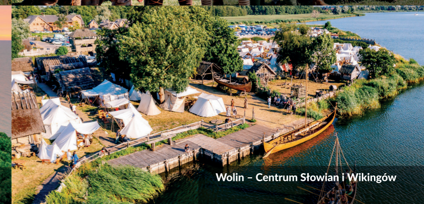
Wolin – Centrum Słowian i Wikingów