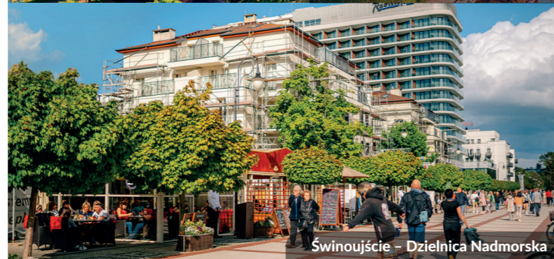
Świnoujście – Dzielnica Nadmorska