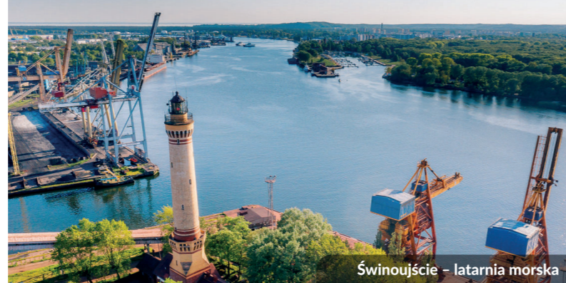
Świnoujście – latarnia morska

Budowę tras rowerowych dofinansowano z Funduszy Europejskich