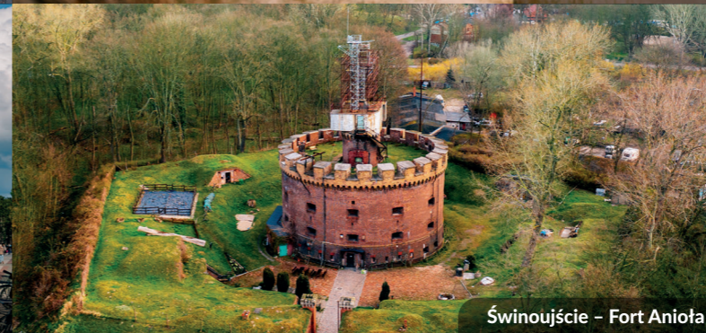
Świnoujście – Fort Anioła