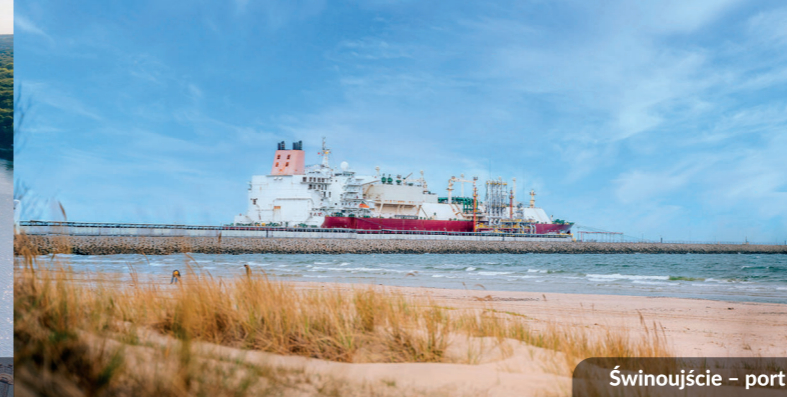
Świnoujście – port