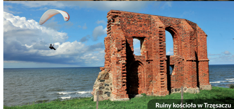
Ruiny kościoła w Trzszacu