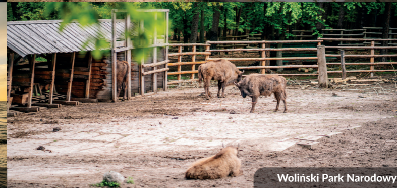
Woliński Park Narodowy