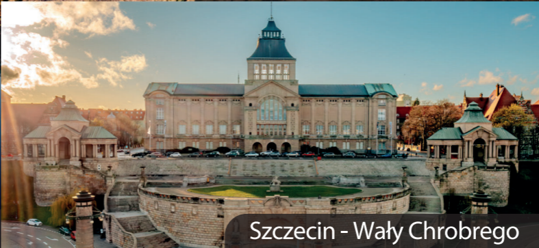
Szczecin - Wały Chrobrego