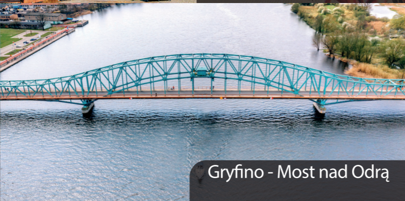
Gryfino - Most nad Odrą