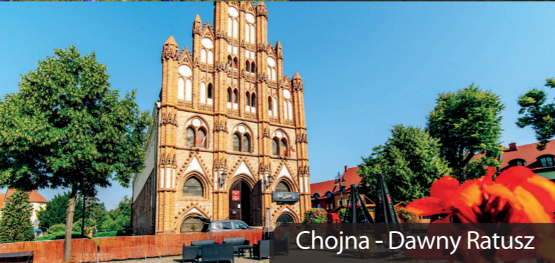
Chojna - Dawny Ratusz