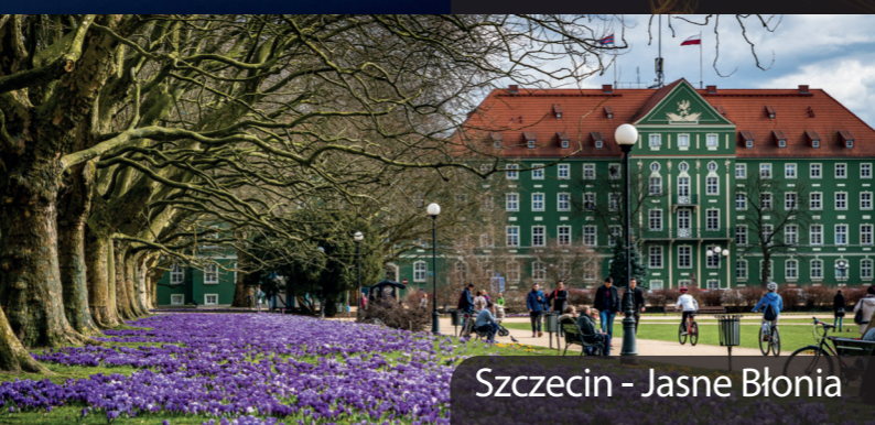
Szczecin - Jasne Błonia