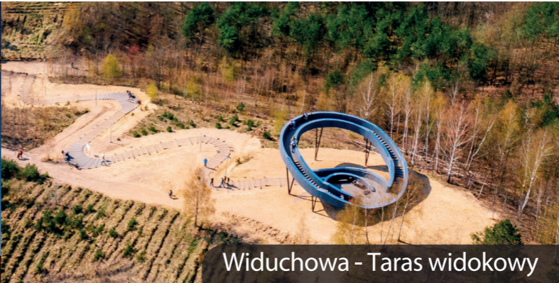
Widuchowa - Taras widokowy