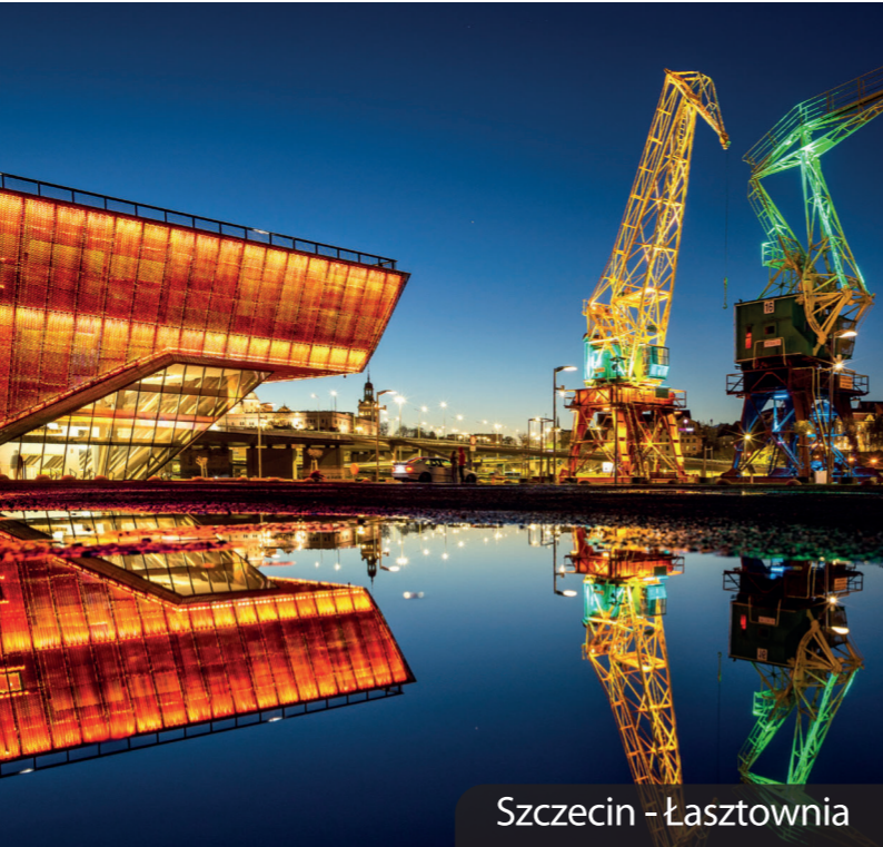
Szczecin - Łasztownia

Budowę tras rowerowych dofinansowano z Funduszy Europejskich