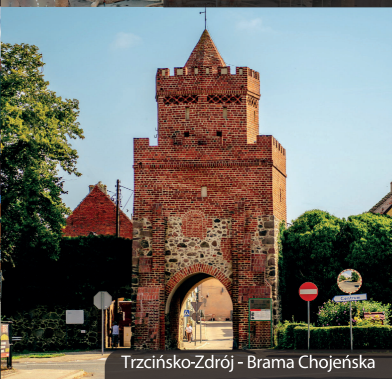
Trzcianko-Zdrój - Brama Chojeńska