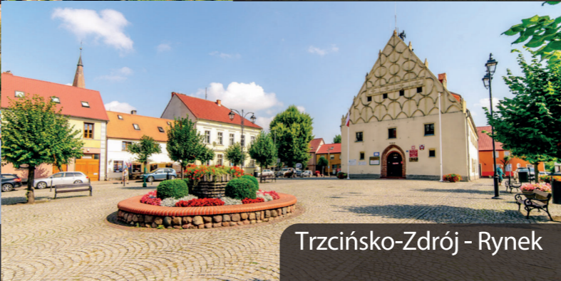
Trzcianko-Zdrój - Rynek