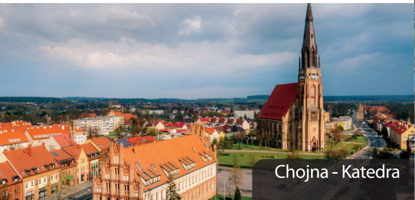
Chojna - Katedra