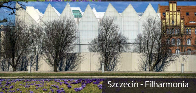
Szczecin - Filharmonia