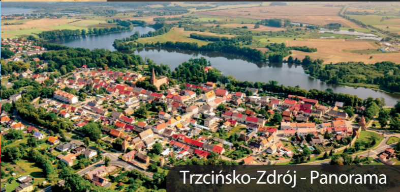
Trzcianko-Zdrój - Panorama