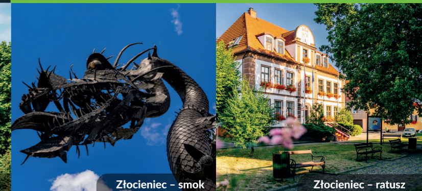
Złocieniec - smok