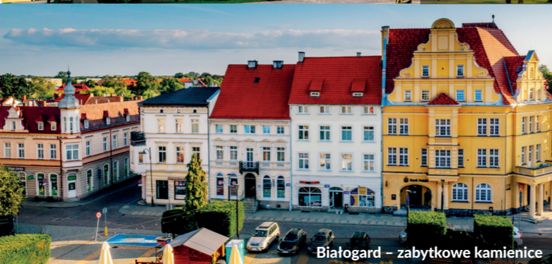
Białogard - zabytkowe kamienice