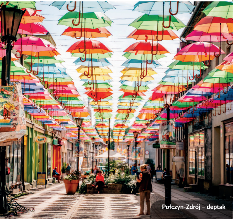
Połczyn-Zdrój - deptak