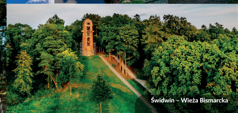
Świdwin - Wieża Bismarcka