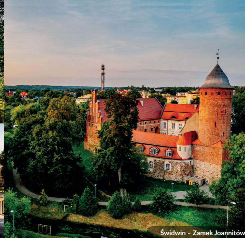
Świdwin - Zamek Joannitów