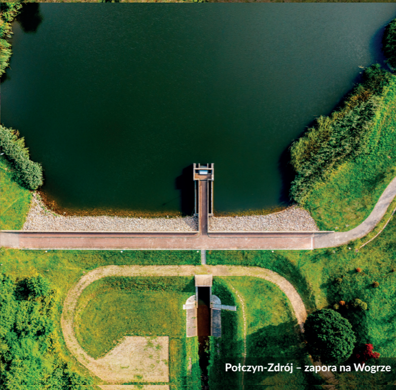
Połczyn-Zdrój - zaporę na Wogrze