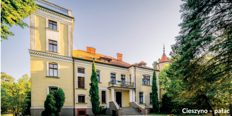
Cieszyno - pałac

Budowę tras rowerowych dofinansowano z Funduszy Europejskich