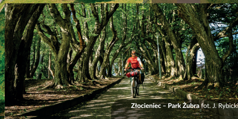
Złocieniec - Park Żubra